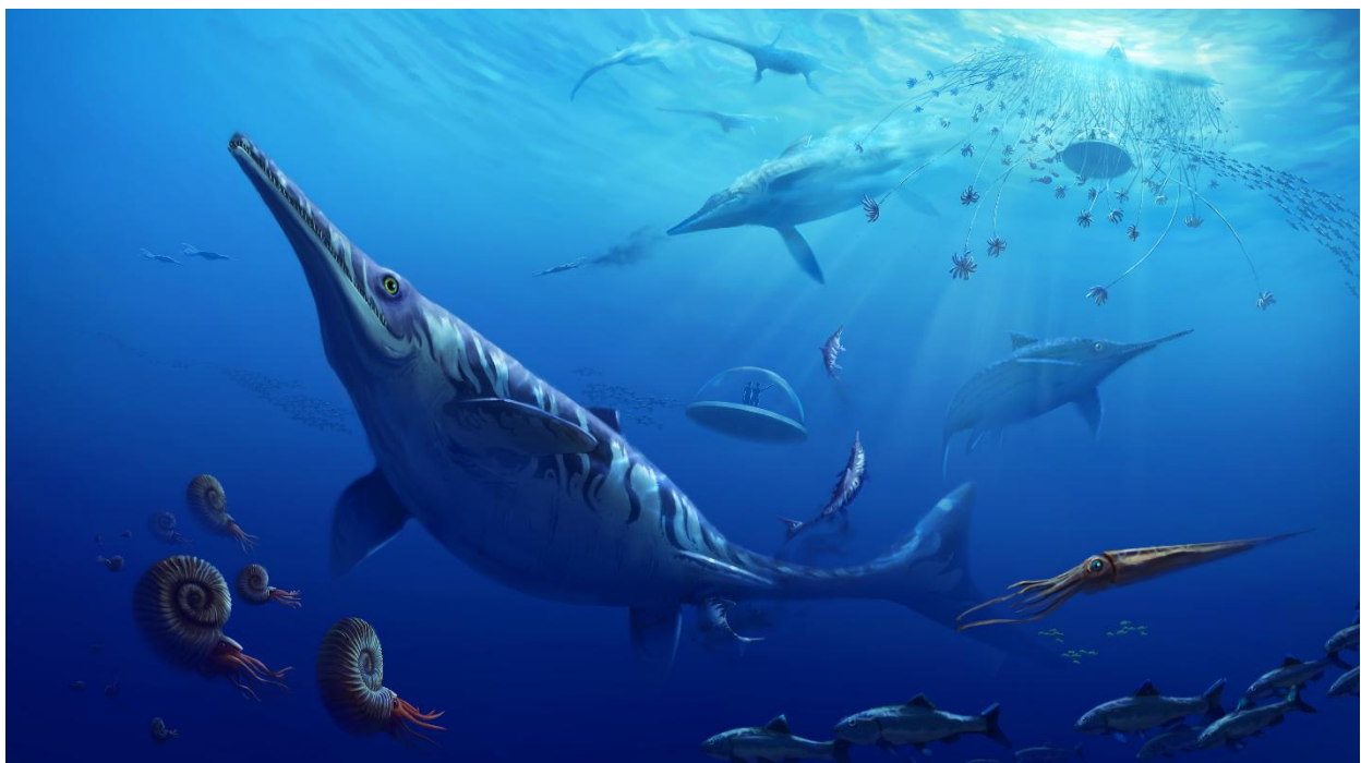
Reconstitution de l'environnement de Holzmaden