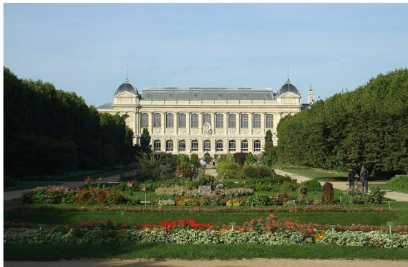
Le Jardin des Plantes et le Muséum National d'Histoire Naturelle de Paris