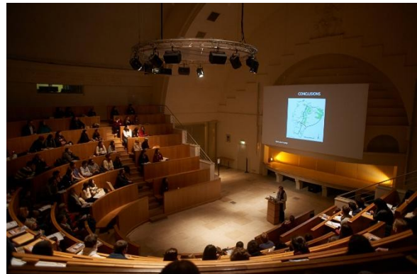
L'amphithéâtre Verniquet